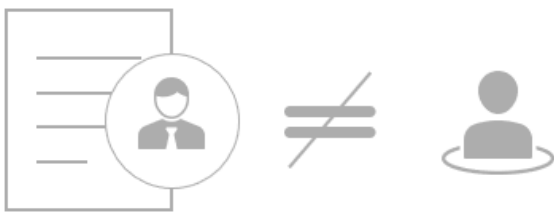
Abbildung 2: Abgrenzung zwischen Rolle in Persona gemäß Umsetzungsstrategie BIM für Bundesbauten Anlage A

BIM-Rollen sind als teilbar und kombinierbar zu betrachten. Eine Person kann in ihrer Tätigkeit Bestandteile mehrerer BIM-Rollen haben und eine BIM-Rolle kann auf mehrere Personen aufgeteilt sein. Referenz hierzu ist die „Arbeitshilfe Rollensteckbriefe“ Arbeitsgemeinschaft BIM4Bundesbau, aus der auch nachfolgende Grafik entnommen ist: